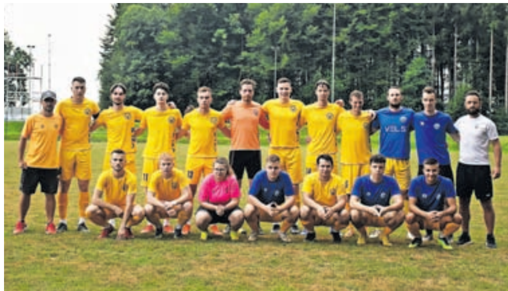
Članska ekipa NK Velesovo Cerklje za sezono 2023/24

Velesovo – Predvsem smo navdušeni nad odzivom otrok, ki se želijo vključiti v naš klub in katerih vpis je ponovno presejal vsa naša pričakovanja. Trenutno v okviru kluba deluje deset otroških in mladinskih selekcij od vrta U6 do kadetske ekipe U17, za katere skrbi ekipa strokovno usposobljenih trenerjev, ki smo jo za novo sezono okrepili še z dvema novima trenerjema. Se pa zaradi vse več novih otrok in posledično dodatnih selekcij soočamo z vse večjo prostorsko stisko in vsi skupaj že nestrpnost pričakujemo prenovo pomožnega igrišča z novo umetno travo. Tukaj gre zagotovo velika zahvala naši občini, ki razume potrebo po dodatnih površinah za treninge in tekme in je v občinski proračun za leto 2023 uvrstila tudi investicije v Nogometnem centru v Velesovem. Kljub temu da je naša članska ekipa v novo sezono vstopila zelo pomlajena, je odlično startala v ligi in trenutno tudi zaseda vrh ligaške lestvice. Dejstvo, da je najmlajša ekipa v ligi MNZ Gorenjske in sestavljena večinoma iz domačih igralcev, nas navdaja s še večjim optimizmom za vse prihajajoče sezone. Člansko ekipo bosta tudi v novi sezoni vodila do-