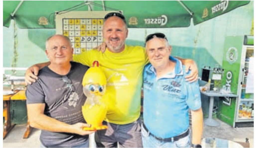
Na društvenem družinskem pikniku

Cerklje – Po uspešno organiziranih prireditvah pozimi in spomladi smo v Društvu obrtnikov in podjetnikov Cerklje poletne mesece namenili za sproščeno medsebojno druženje. Na letošnji dvodnevni izlet smo se odpravili v hrvaško Istro, kjer smo prvi dan najprej obiskali uspešno družinsko podjetje Aura v Buzetu, se v Rovinju vkrcali na ladjico za panoramsko vožnjo s piknikom, lep poletni dan pa zaključili z obiskom Medulina, kjer so nas sprejeli predstavniki našega pobratenega mesta, župan in predstavniki Turističnega združenja. Naslednji dan smo največ časa posvetili obisku narodnega parka na Brionih z bogato zgodovino, ob vrnitvi z otoka pa se srečali z našim članom, ki nam je v Fažani pripravil dobrodošlico, za kar se mu lepo zahvaljujemo. Na poti domov smo obiskali še »najmanjše mesto na svetu – Hum«, v katerem živi le peščica prebivalcev, vendar na svojevrsten način pritegnejo številne obiskovalce. Poletje je prav tako čas za tradicionalni društveni družinski piknik, ki smo ga letos organizirali s pomočjo Pizzerije pod Jenkovo lipo in se ga je udeležilo lepo število članov in njihovih družin. Osrednji dogodek