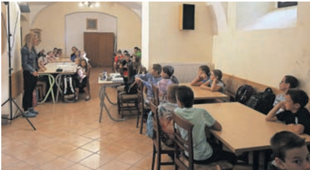
Učenci petih razredov imajo pouk v prostorih župnišča v Adergasu.