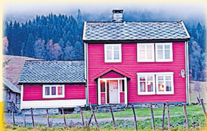
Tipična norveška hiša

V sklopu pouka so se dijakinje in dijaki preizkusili v številnih dejavnostih , kot so ribolov, lov na jelenjad in ptice, pohodništvo ... Ogledali so si tako kulturne kot naravne znamenitosti, raziskovali bližnja mesta ter odkrivali norveško kulturo, njihove navade in običaje.