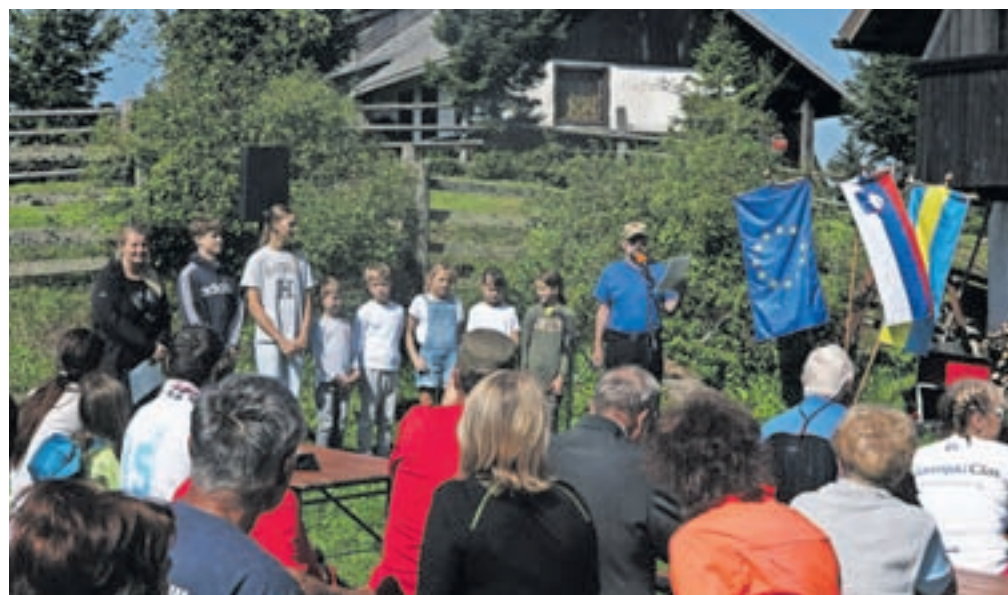
Kulturni program so na Jezercih pripravili učenci Osnovne šole Davorina Jenka.