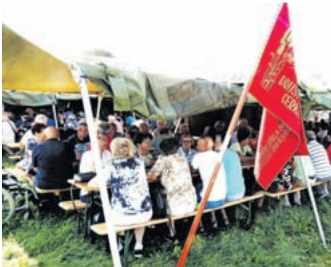
Na pikniku se je zbralo več kot dvesto petdeset članov. Zavetje pred vročino so poiskali pod šotoroma.

Društvo ima 791 članov, ki lahko balinajo, igrajo namizni tenis, kolesarijo, se udeležujejo pohodov, planinarijo, se ukvarjajo z ročnimi deli, delujejo v likovni in kulturni sekciji, telovadijo in plešejo, hodijo na izlete in letovanja.