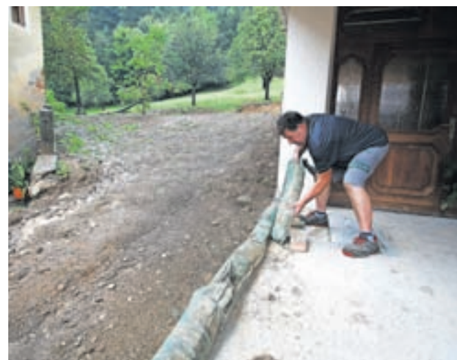
Zaščita vhoda v stanovanjsko hišo ob napovedi nalivov konec avgusta

ske poslopje. Na pomoč jim je priskočilo še okoli 50 prostovoljcev iz vasi Pšata, sosedje, sorodniki, prijatelji in sodelavci. Delali so do noči, da so rešili stanovanjski del in hlev. Čiščenje so nadaljevali še v ponedeljek, torek in sredo, predvsem tistega, kar je bilo nanoseno do hiše.