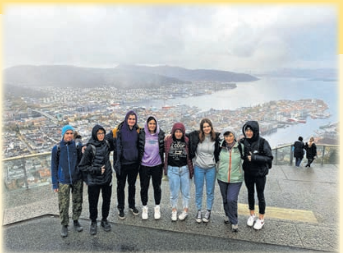
Dijakinje in dijaki z učiteljico na Norveškem

V tem kratkem času so uspeli pridobiti nekaj novih prijateljev , Norvežani so jih zelo lepo sprejeli. Ugotovili so, da stereotipi o hladnih severnjakih ne držijo , saj so bili Norvežani zelo gostoljubni in odprti , slovenske dijakinje in dijake so hitro sprejeli za svoje, jih vključili v skupne aktivnosti.