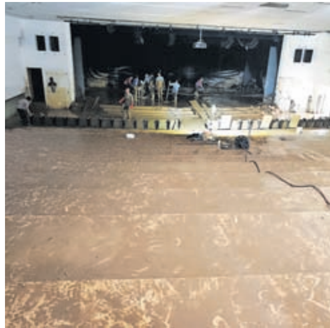
Čiščenje dvorane

Nihče pa takrat niti v najhujših nočnih morah ni pomislil, da se lahko zgodi 4. av-