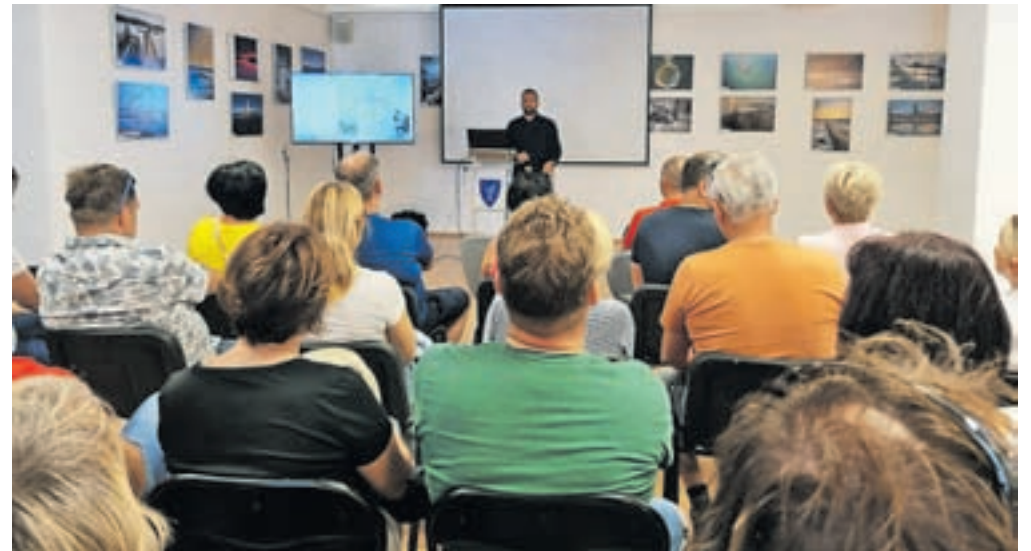
Na obisku v Medulinu

piknika je vsakoletna tombola, kjer glavno vlogo izvedbe uspešno prevzame bivaša predsednika društva